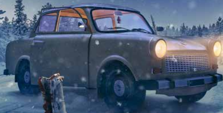
Illustration: Yours Kommunikationsbyrå

– en operatragedi om en familj som möter oanad kärlek, passion och ostoppeligt rus!